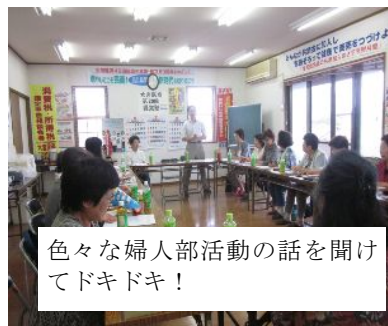
色々な婦人部活動の話を開けてドキドキ!

6月16日(木)午後1時より大宮民商会議室をお借りして上尾、桶川北本、岩槻、大宮、浦和民商総勢21名で、浦和婦人部から6名が参加しました。婦人部の手引きと私達を取り巻く情勢の学習後、休憩を挟み所得税法第56条についてディスカッション形式の学習会を行ない、参加者から活発な意見が数多く寄せられました。